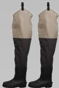
Scierra CC3 Hip Vaders Før 999.- Nu 799.-