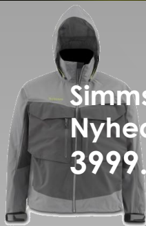
Simms G3 Jakke Nyhed 2015 3999.-