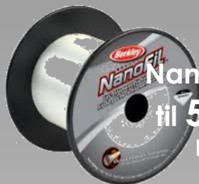
Nanofil påspoling til 50% (Så længe lager haves)