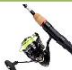
Daiwa Ninja Spinnesæt Før 1299,- Nu kun 899,-