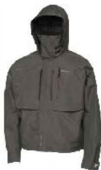
Sierra Fusiontech Vadejakke Før 1799,- Nu kun 799,-